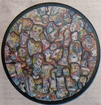
Espiritualidad y poesía es la combinación de estas imágenes.