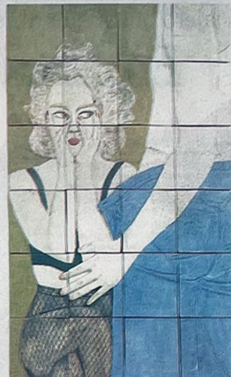
Sencillez y pulcritud, combinación armoniosa de colores con dosis de creatividad.

Esta artista trata sus piezas con sencillez y pulcritud; combina armoniosamente los colores con una acertada dosis de creatividad donde se ha operado una interesante simbiosis de forma y fondo en la noble materia del barro. Dominadora de su técnica logra darle calidad a sus obras de imágenes construidas con planos de colores delimitados en áreas cerradas por la línea del contorno o con trazos incisivos bordeando las figuras.