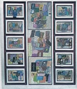
Lo espiritual en medio de la materia teje el contrapunto de las figuras.

Esta artista trata sus piezas con sencillez y pulcritud; combina armoniosamente los colores con una acertada dosis de creatividad donde se ha operado una interesante simbiosis de forma y fondo en la noble materia del barro. Dominadora de su técnica logra darle calidad a sus obras de imágenes construidas con planos de colores delimitados en áreas cerradas por la línea del contorno o con trazos incisivos bordeando las figuras.