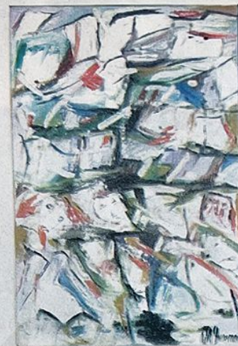
Figuración y abstracción conjuga estas imágenes.

Teresa sabe jugar con picardía criolla y mordacidad la temática de la seducción. Así en "Herramientas de la seducción" nos presenta a una joven esbelta, hermosa, en minifalda negra y zapatos celestes de tacones altos. Recostada sobre una silla muestra sus encantos y atributos más seductores que nos recuerdan a las mujeres de los programas frívolos de la televisión sin ningún contenido válido que no sea mostrar el cuerpo en su fuerza bruta.