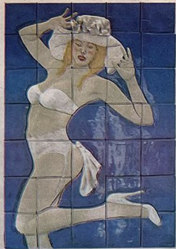
Picardía criolla y mordacidad: la temática de la seducción.

Sus composiciones aparentemente estáticas por la geometría del cuadrado en la mente del espectador son dinámicas por las imágenes recreativas de personajes y objetos que conviven en espacios delimitados. Ella construye pequeños cuadrados donde se guardan diversos objetos cuya reunión crea un cierto encanto y mis-