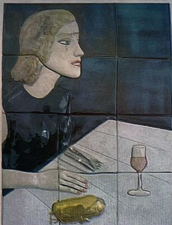
Perversa. Imágenes con planos de colores delimitados por la línea del contorno o con trazos incisivos bordeando las figuras.